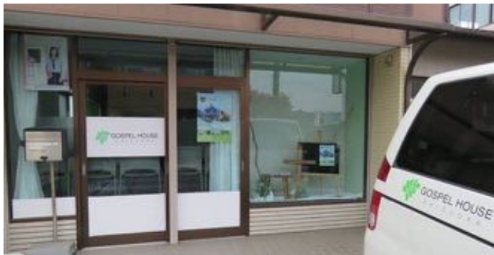
Gospel House Shizuoka

Grannens körsbärsträd blommar för fullt. Våren är på väg. I vanliga fall blommar det japanska körsbärsträdet i april, men det finns ett körsbärsträd som blommar i februari, kawazu-sakura. Det sägs att det finns runt 600 olika variationer på så kallade körsbärsträd (sakura) i Japan. Med andra ord 600 olika variationer på sakura-blommor. Kawazu-sakuran har fått sitt namn från en stad i Shizuoka prefektur. För oss som bor i Shizuoka är kawazu-sakuran en profet som deklarerar vårens ankomst. Ännu är det kallt på morgonen och kvällen vilket gör att vi måste tända kerosinkaminen. (Det är inte roligt att vakna med en rumstemperatur på +10 . . .)