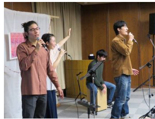
Några foton från vår Valentine Sunday Service

Det är 15 år sedan vi planterade församlingen Gospel House Shizuoka. Utvecklingen kanske inte blev som vi först hade tänkt, men tittar vi tillbaka kan vi se hur Gud i sin trofasthet burit oss och hjälpt oss. Det ska bli spännande och se hur församlingen kommer att växa framöver. Vi har redan i tro planerat dop till sommaren! Att vi som församling är där vi är i dag är tack vare förbön och stöd från Filadelfiakyrkan. TACK!