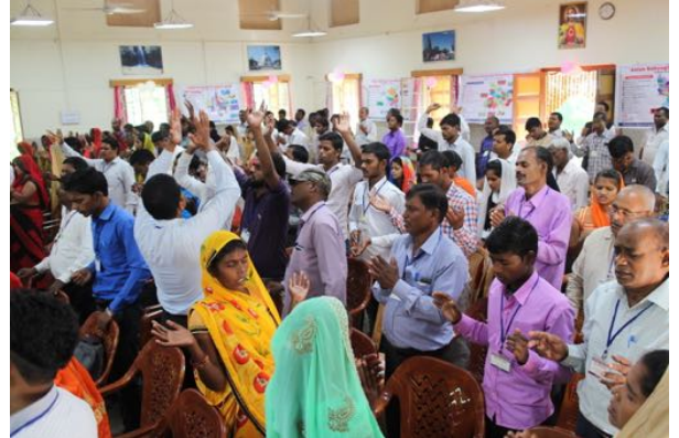
Lovsång, bön och glädje under konferensen i Indien