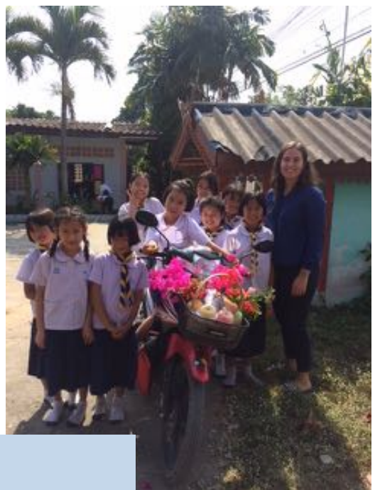
Charmiga elever och en glad lärare!

En välsignad sommar önskar redaktören alla läsare av FiladelfiaNU!