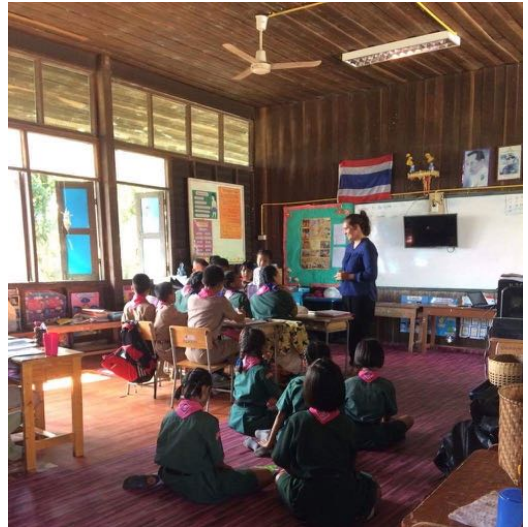
Koncentration i klassrummet

Boka in dessa söndagkvällar redan nu i din kalender. Tiden är 18.00 – 19.30