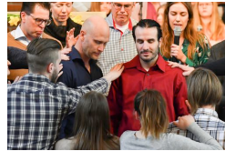
Många ville vara med och välsigna de nydöpta