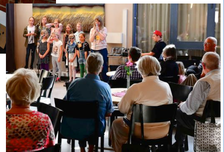
. . . och i Ljussgården kunde man vila fötterna, fika och lyssna till musik av stora och små.