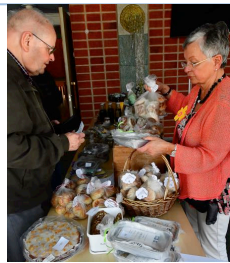
. . . bembakat till eftermiddagskaffet . . .