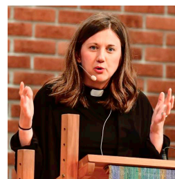
vi på väg?" och du kan både läsa och lyssna på predikan på vår hemsida. Rekommenderas!