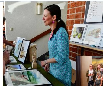
. . . fina tavlor och hantverk av olika slag och mycket annat fanns att köpa . . . .