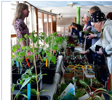
Plantor till sommarens trädgårdsland, pallkragar eller balkonglådor . . .